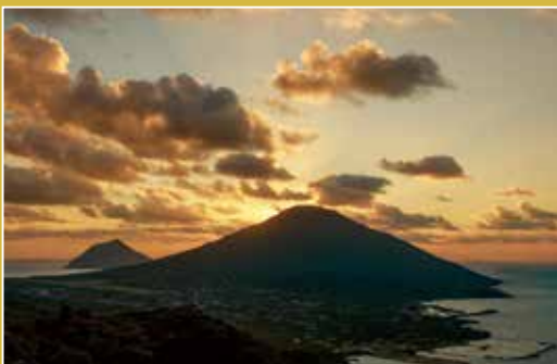
spot 登龍岬展望台 map_⑩ 太平洋に浮かぶ八丈小島は、朝日や夕日に照らされると、山の稜線が美しく浮かび上がり、より一層幻想的な姿を見せてくれます。