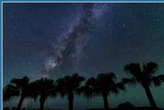
spot 南原スポーツ公園 map_⑤ 芝生グラウンドのヤシの木と星空を眺める穴場スポット。