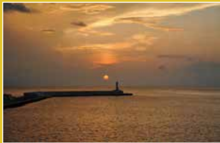
Morning 底土港から見た朝焼け map_⑨