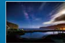
温泉に浸かりながら天体観測 (みはらしの湯)