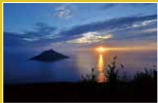
八丈小島展望台から八丈小島を望む