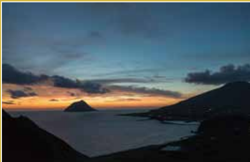
spot 大坂トンネル展望台 map_⑦ 広大な空と海を一望できる鉄道の映えスポット。右手に八丈富士、左手に八丈小島を望むことができる。