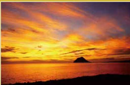
spot 横間海岸 map_⑥ 黒潮で磨かれた玉石が広がる海岸。正面右手に八丈小島を望み、八丈富士や大坂トンネルを見上げる抜群のロケーションです。