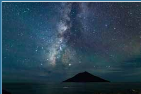
spot 南原千畳岩海岸 map_⑥ 八丈富士の噴火で形成された溶岩台地から見る、満天の星。

島の南の海岸線は外灯が少なく、 夜空に輝く星々を鮮明に見ることができます。 月もはっきりと輪郭が浮かんでおり、 思わず見惚れる美しさです。