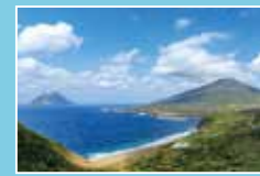
大坂トンネル展望台 ⑩